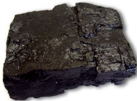
चित्र 3.1 : कोयला।

में वृद्धि के साथ-साथ दूसरी और तीसरी पीढ़ी में उपभोक्ताओं की संख्या अधिक है। प्रत्येक समूह के लिए मेज़ पर एक पूरा भरा पात्र रख दीजिए। प्रत्येक समूह की पहली पीढ़ी के उपभोक्ताओं से कहिए कि वे अपने समूह के पात्र से वस्तुओं का उपभोग करें। अब प्रत्येक समूह की दूसरी पीढ़ी को भी वैसा ही करने को कहिए। विद्यार्थियों से कहिए कि वे प्रत्येक पात्र में वस्तुओं की उपलब्धता को ध्यान से देखें। यदि पात्रों में कुछ शेष बचा है तो प्रत्येक समूह की तीसरी पीढ़ी को इसका उपभोग करने के लिए कहिए। अब अन्तिम रूप से देखिए कि तीसरी पीढ़ी के सभी उपभोक्ताओं को खाने हेतु कुछ मिला या नहीं। यह भी देखिए कि क्या पात्रों में अब भी कुछ शेष बच गया है।