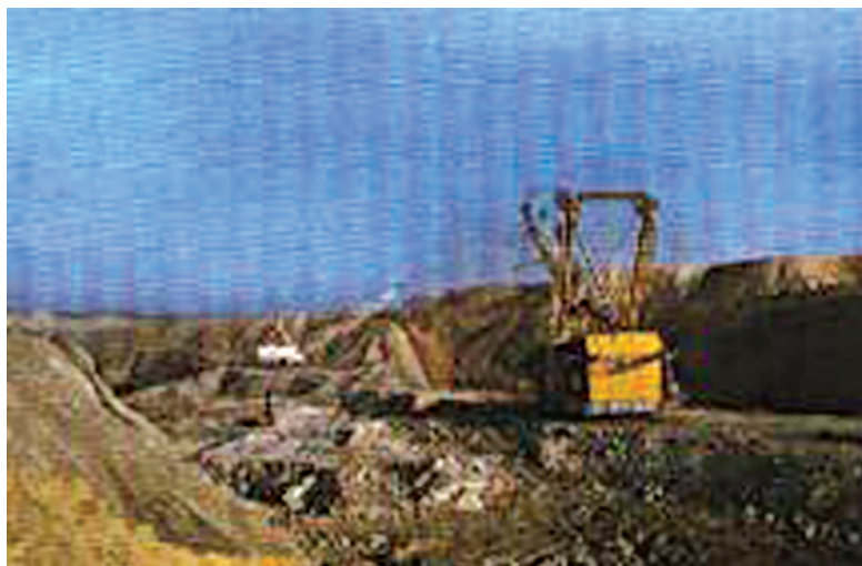
चित्र 3.2 : कोयले की एक खान।

वायु में गर्म करने पर कोयला जलता है और मुख्य रूप से कार्बन डाइऑक्साइड गैस उत्पन्न करता है।