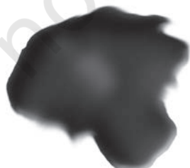
चित्र 3.3 : कोलतार।

यह एक अप्रिय गंध वाला काला गाढ़ा द्रव होता है (चित्र 3.3)। यह लगभग 200 पदार्थों का मिश्रण