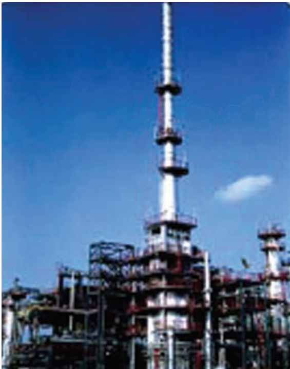
चित्र 3.5 : पेट्रोलियम परिष्करण।

को पृथक करने का प्रक्रम परिष्करण कहलाता है। यह कार्य पेट्रोलियम परिष्करण में सम्पादित किया जाता है (चित्र 3.5)।