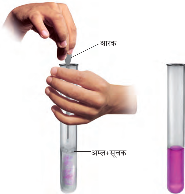
चित्र 4.4 उदासीनीकरण का प्रक्रम

(चित्र 4.4)। परखनली को धीरे-धीरे हिलाइए। क्या आपको अम्ल के रंग में कोई परिवर्तन दिखाई देता है?