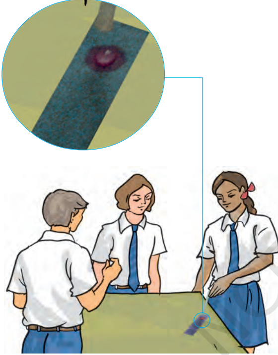
चित्र 4.2 लिटमस परीक्षण करते हुए बच्चे