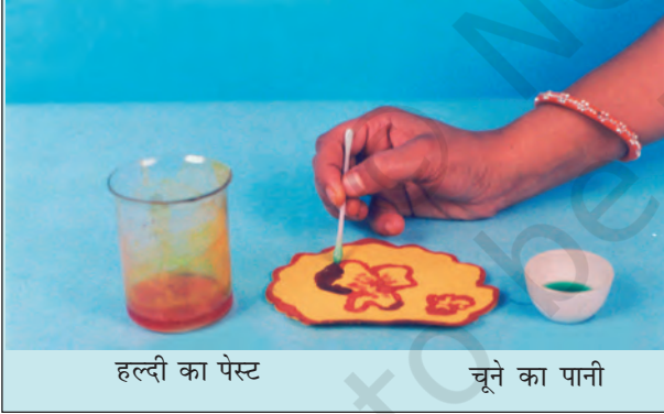
हल्दी का पेस्ट

आप अपनी माताजी के जन्मदिन पर, उनके लिए विशेष बधाई पत्र बना सकते हैं। सादे सफेद कागज़ की शीट पर हल्दी का पेस्ट लगाइए और उसे सुखा लीजिए। रुई के फाहे की सहायता से इस पर चूने के पानी से एक खूबसूरत फूल बनाइए। आपको एक सुंदर बधाई पत्र मिल जाएगा।