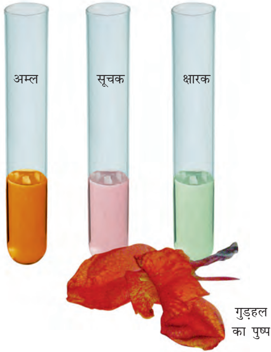
चित्र 4.3 गुड़हल का पुष्प और उससे तैयार किया गया सूचक

आप इन प्राकृतिक सूचकों को बनाकर उनसे अम्लीय, क्षारकीय और उदासीन विलयनों में रंग परिवर्तन देखने का प्रयास कर सकते हैं।